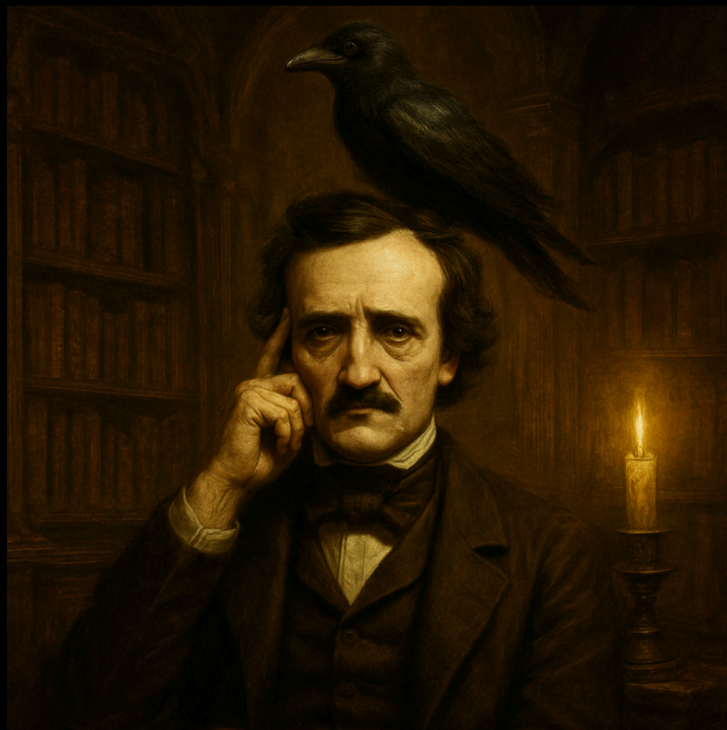
Imagem gerada por IA