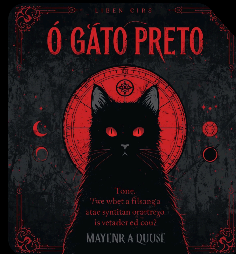
Imagem gerada por IA