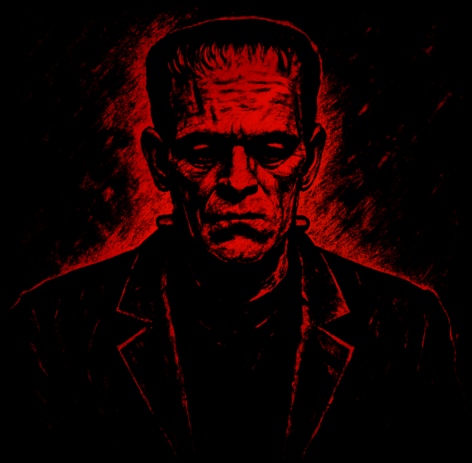
Imagem gerada por IA

Possui algum “causo” ou história sobrenatural?