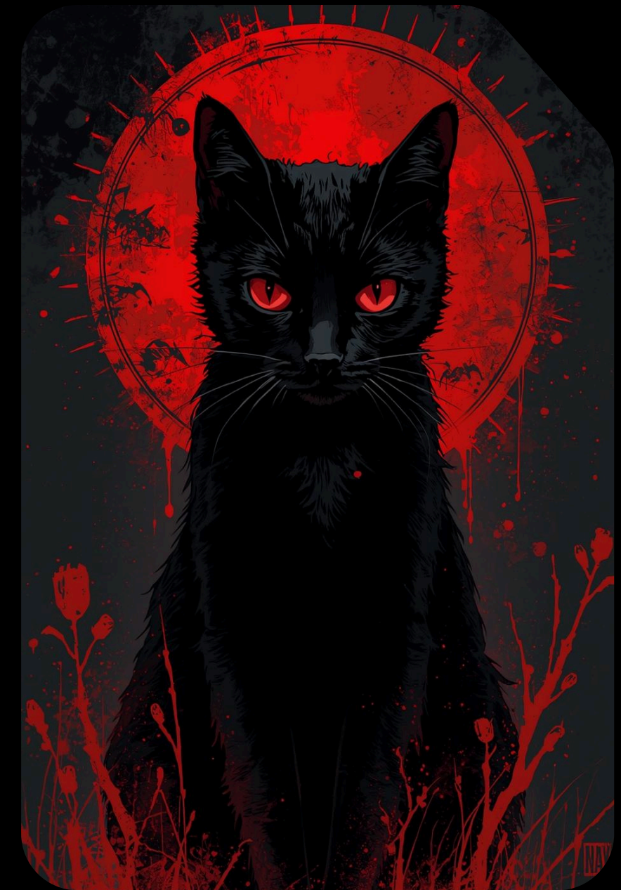
Imagem gerada por IA