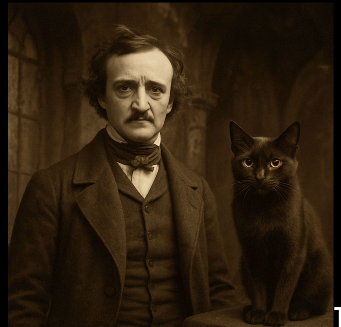
Imagem gerada por IA