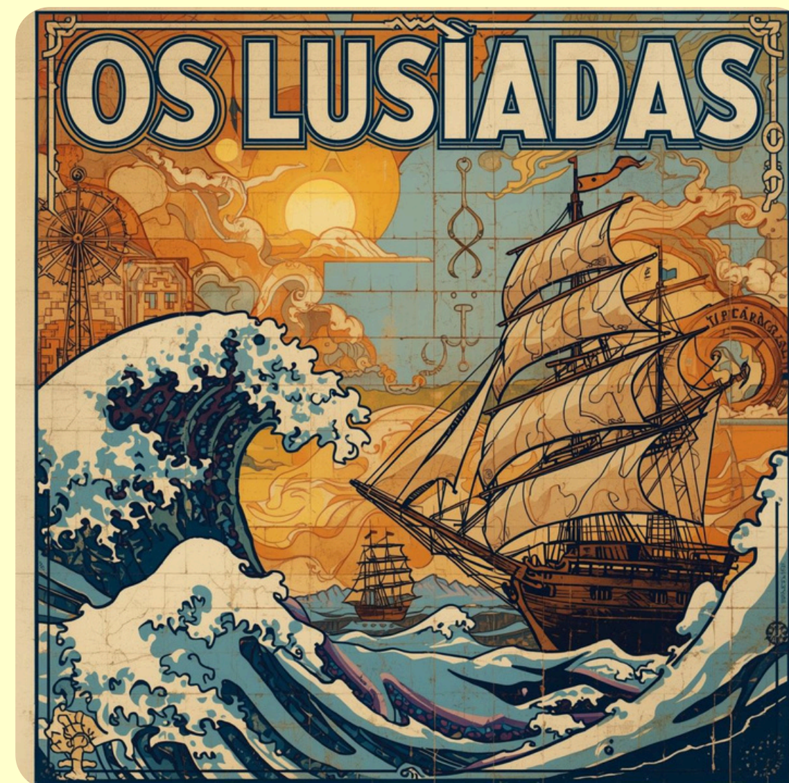
Imagem gerada por IA

1. Camões coloca Portugal em nível semelhante à Grécia em termos literários porque compõe essa obra-prima à semelhança de A Iliada e Odisseia, textos fundadores da literatura ocidental;