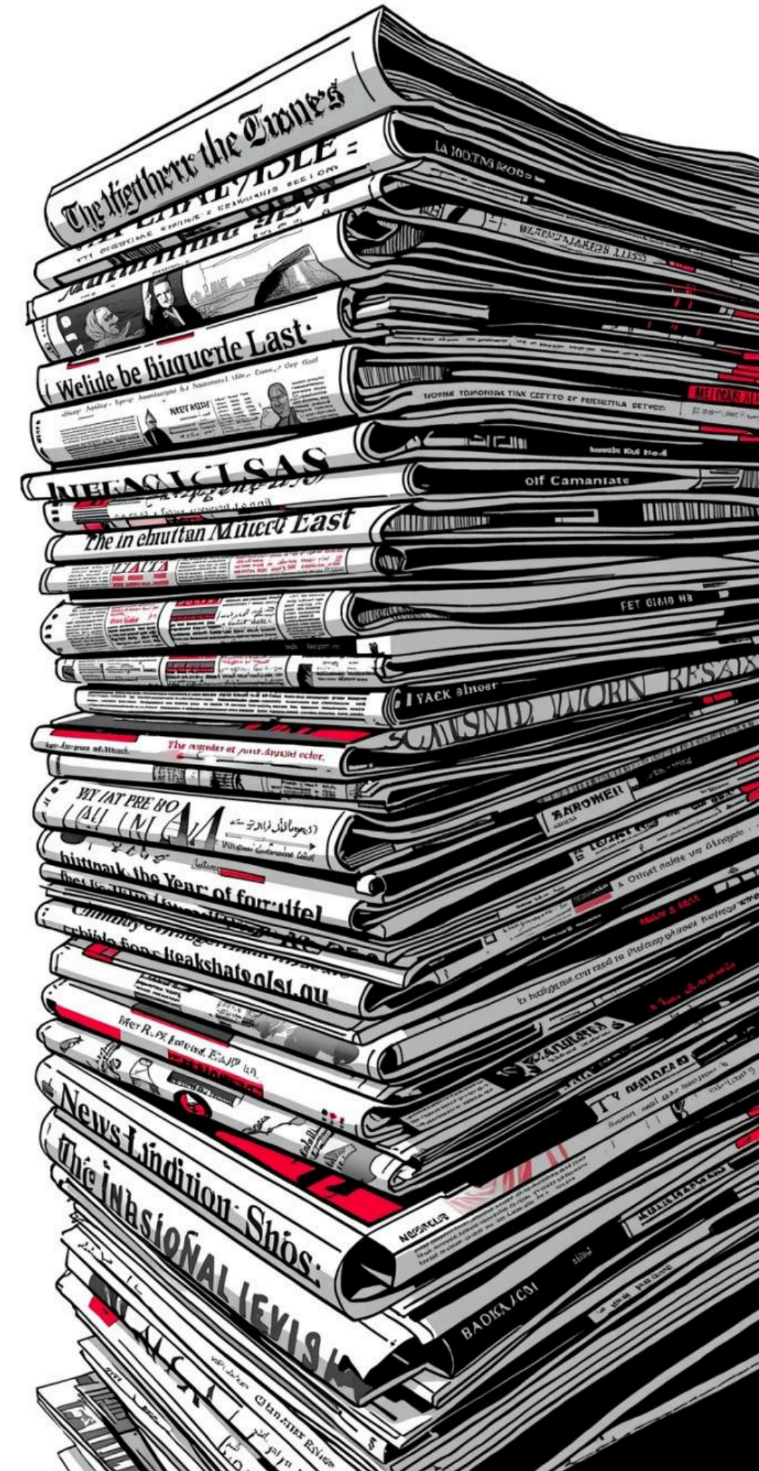
Imagem gerada por IA